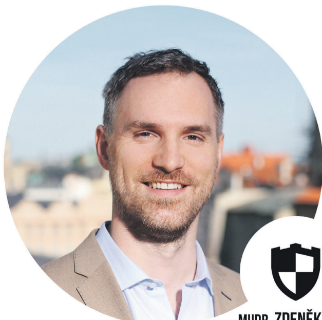
MUDR. ZDENĚK HŘIB manažer a informatik kandidát na primátora hl. m. Prahy