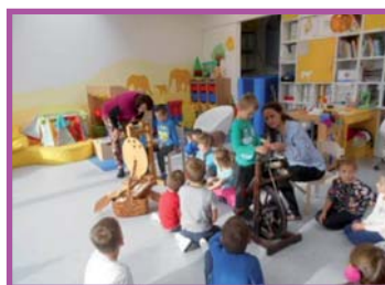
Z vlnky ke klubíčku