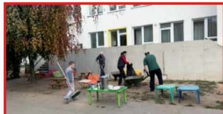
Podzimní brigáda na zahradě bud. Kollárova

Vánoční čas je krásné téma, kterému věnujeme velký zájem a pozornost i při realizaci vzdělávacího programu. O Vánocích si nejen povídáme a učíme, ale také v jejich duchu tvoříme. Děti si vyrábí ozdobičky do pokojíčků, dárky pro rodiče, ale tvoří i na vánoční jarmark, kde bude mít naše školka opět svůj stánek.