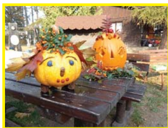
Budova Pražská – „Dýňování“

Jsm rádi, že výrobky dětí slaví i úspěchy na soutěžích, kterých se třídy zúčastňují. Dělá to velikou radost nejen nám, ale hlavně dětem. Hned několik cen jsme získali na XI. úvalském jablokobrání. Po zásluze oceněny byly i třídy na budově Pražská, které se účastnily výtvarné soutěže „Dýňování“, pořadající MDDM Úvaly.