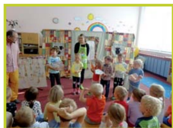
Divadlo pana Kubce

Rozmanitý program probíhal i na jednotlivých budovách. Budova Pražská hostila Divadlo ze skříně („Jak Anča s Barčou léčily lenoru“) a sliny se všem sbíhaly u Divadla pana Kubce („Veselé vaření“). Děti na budově Bulharská měly možnost vidět nejen zajímavý edukativní program pro školky o zpracování vlny „Z vlnky ke klubíčku“, ale i roz-