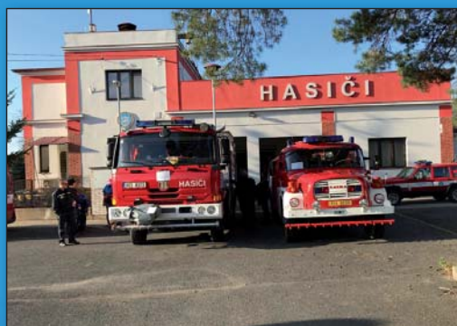
Den otevřených dveří u hasičů, str. 14