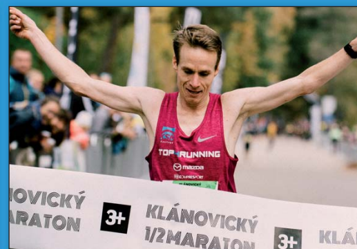
Vítěz Klánovického půlmaratonu, str. 21