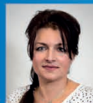
kandidát č. 3 do MČ Koloděje

Zájemci volejte: Pavla Fiury - tel. č. 724 162 295