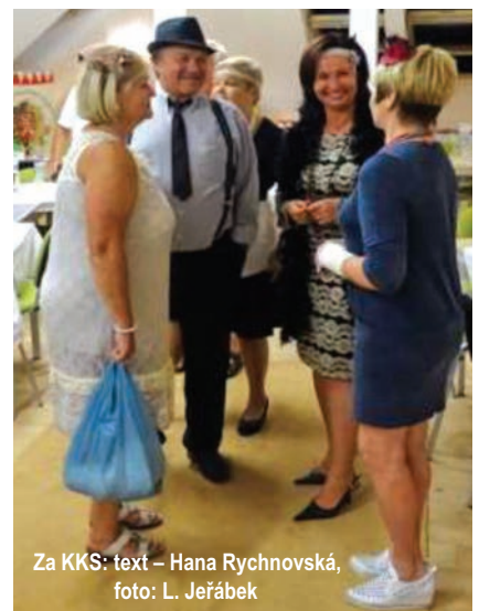
Za KKS: text – Hana Rychnovská, foto: L. Jeřábek