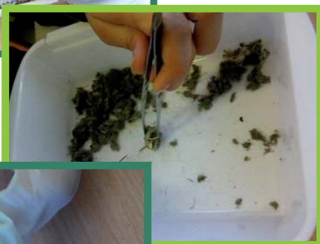
Rozebraný vývržek kalouse ušatého