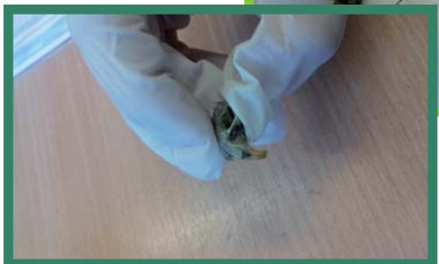
Lebka drobného hlodavce