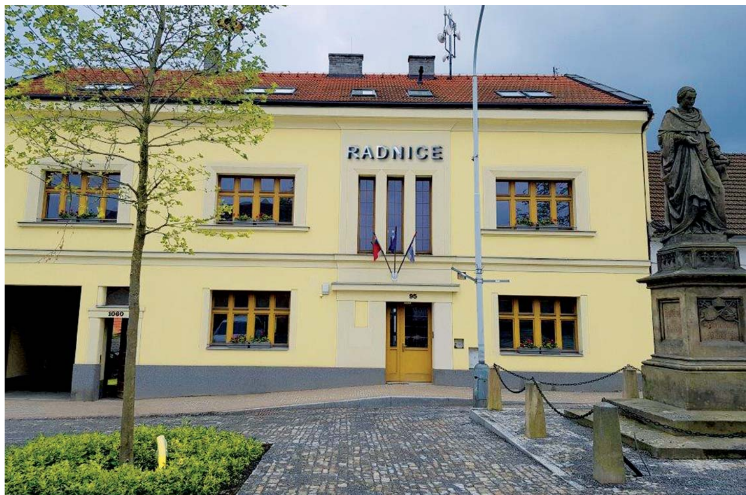
Nová radnice v Úvalech – strana 3