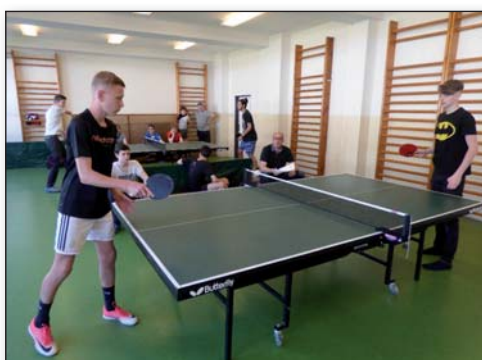
Turnaj ve stolním tenise, str. 22