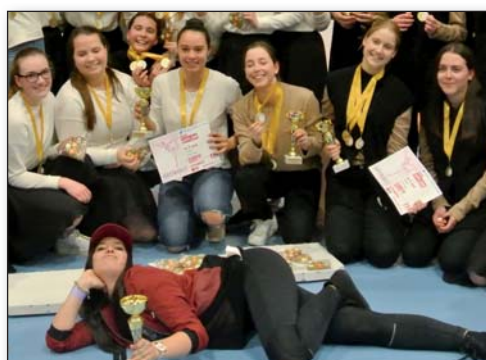
Mladí úvalští tanečníci, str. 16