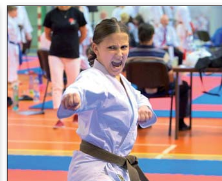
Úvalský klub karate, str. 25