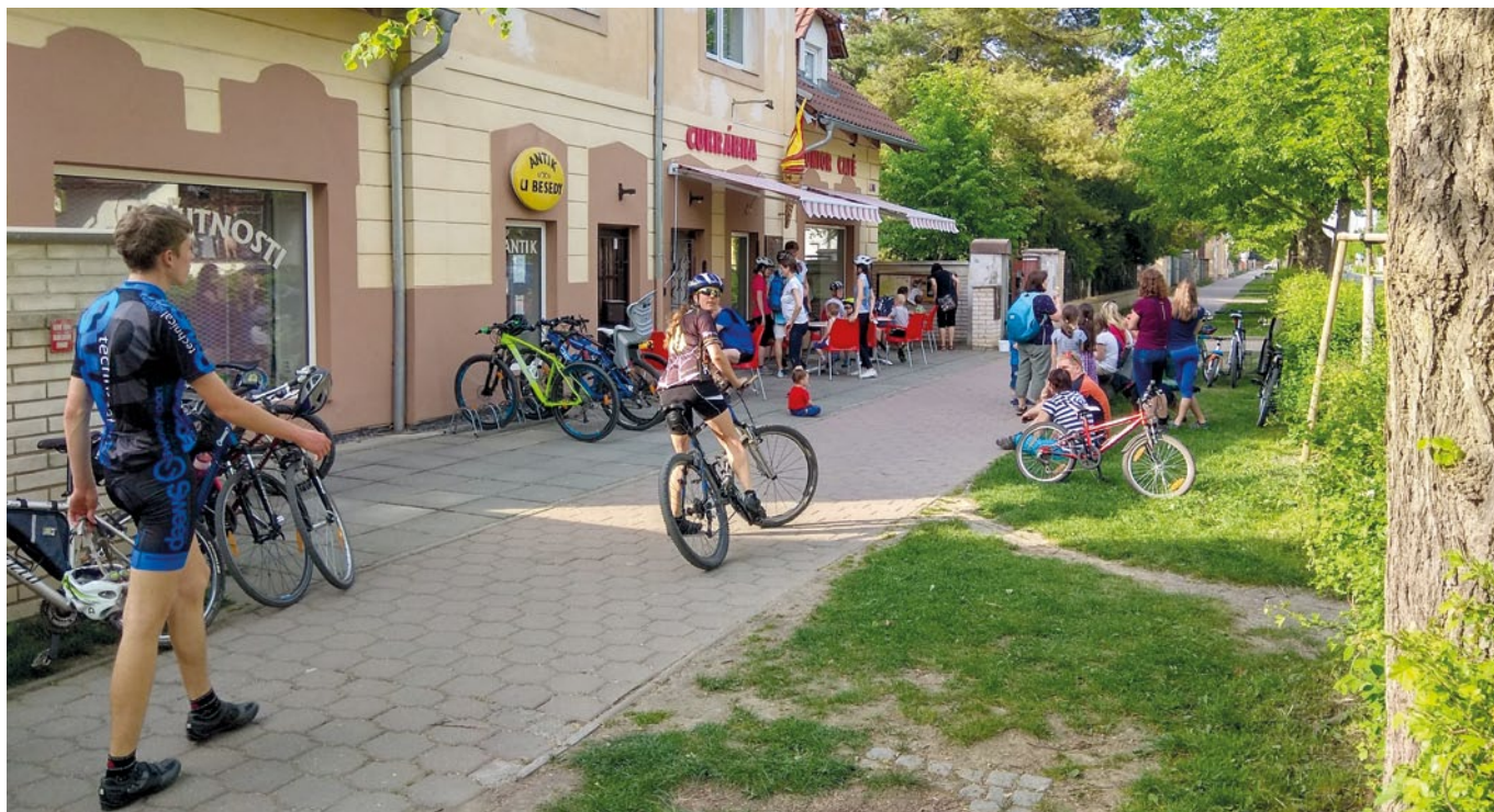
Klánovická cukrárna je o hezkých jarních víkendech doslova obsypána cyklisty