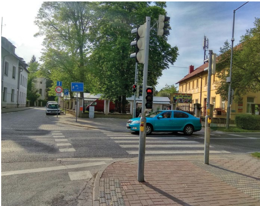
Cyklosemafor u školy. Od nikud nikam.

V záměru rekonstrukce chodníku na Slavětínské nebyla kombinovaná cyklotrasa s chodníkem. Jednalo se o dotaci na opravu stávajícího chodníku z fondů EU. Budování cyklostezek je řízeno zcela jinými pravidly a na Slavětínské není vhodné ani možné. Je to nebezpečné rušné místo protínané frekventovanými kolmými ulicemi. Každý cyklista pojedede logicky zklidněnými bočními ulicemi, Mechovkou, Medinskou, Aranžerskou, Blešnovskou. Pokud vedou cyklostezky obcí, vždy jsou