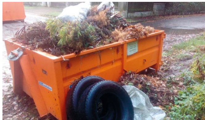
Kontejnery na zelený odpad

MČ Klánovice získala v roce 2014 v rámci projektu Svoz bioodpadu Praha Klánovice pět kontejnerů na zelený odpad. V roce 2017 zakoupila další kontejner. Kontejnery byly původně určeny pouze na trávu a listí a byly vyváženy dvakrát týdně, což bylo naprosto dostačující. Po určitou dobu bylo dovoleno ukládat i menší větve. Bohužel se v kontejnerech začaly objevovat velké větve, dokonce i části pokácených stromů. Na podzim 2017 bylo povoleno ukládat do kontejnerů opět pouze trávu a listí. Bohužel se tento požadavek nenaplnuje a v současné době se opět v kontejnerech objevují větve a kolem kontejnerů se nachází odpad různého druhu – viz přiložené foto. Navíc do kontejnerů odkládají během týdne posekanou trávu i firmy poskytující zahradnické služby. Sama jsem se s jednou takovou firmou u kontejneru setkala. Z uvedených důvodů MČ Klánovice rozhodla změnit dobu přistavení kontejnerů, a to následovně: od 4. května 2018 bude každý pátek přivezen kontejner na určená místa a po víkendu v pondělí odvezen. Klánovičtí občané včetně chatařů můžou dále využívat deponii v pondělí a v pátek od