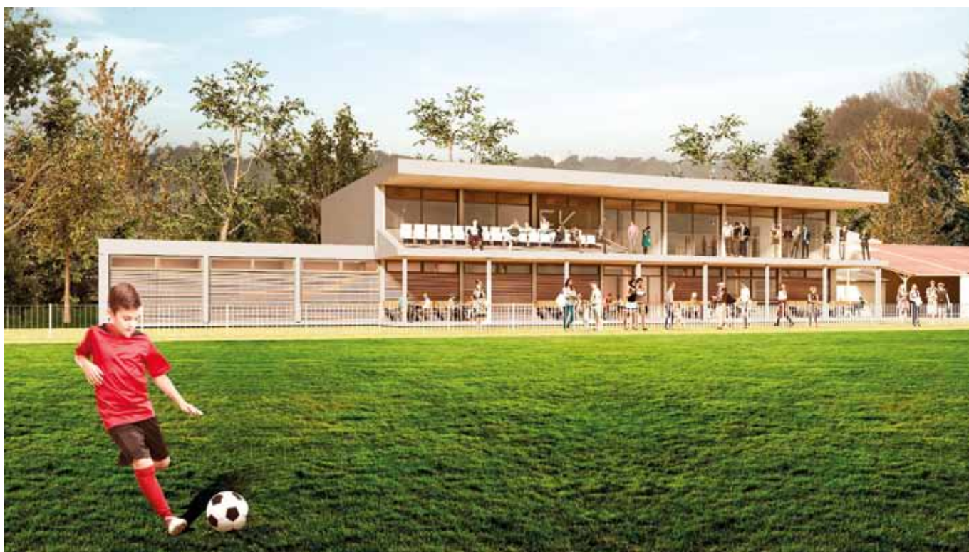
Vizualizace nové tribuny na fotbalovém hřišti