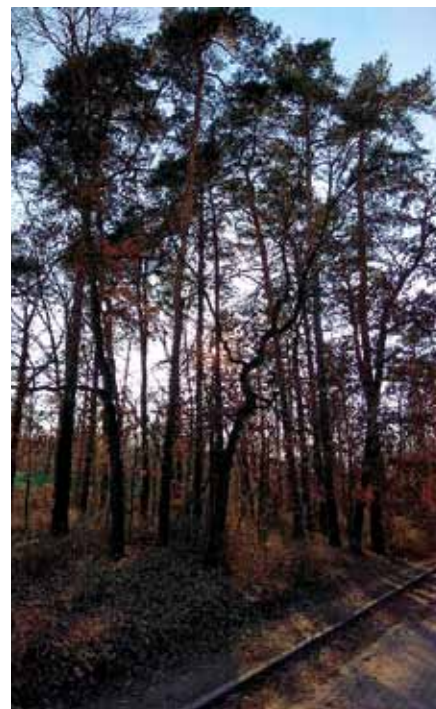
Přibližně tady by mělo být nové parkoviště.