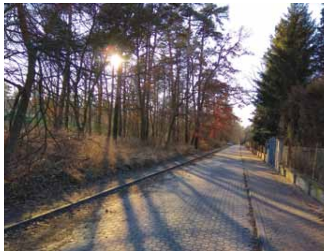
Pro někoho náletové dřeviny, pro jiného krásný, vzrostlý les, který je pro místní důležitou součástí jejich okolí

Neuvažujeme o klasickém P+R parkovišti. Počítáme s tím, že parkoviště by bylo ve správě naší MČ, která by tím pádem určovala podmínky a režim. Předběžně počítáme s tím, že polovina až dvě třetiny kapacity by byly určeny pro klánovické občany. Právě proto je tak důležité svěření pozemku do naší správy.