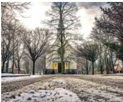
Sníh byl v Klánovicích zatím jen pár dní.

Zimní údržba začíná v listopadu a končí v březnu následujícího roku. Jedná se tedy o pět měsíců. Finanční platba je rozdělena do několika položek, respektive činností, za které se provádí zvlášť. Mezi ně patří pluhování, zametání, posyp a úklid. Pokud je tedy zima chudá na sníh, za tyto činnosti se poskytovateli neplatí. Součástí smlouvy je i tzv. zimní pohotovost (náklady na osobu schopnou vyrazit v časovém termínu do terénu), která je krytá měsíčním paušálem bez ohledu na to, jaké je počasí. Za letošní zimu tedy Klánovice ušetří.