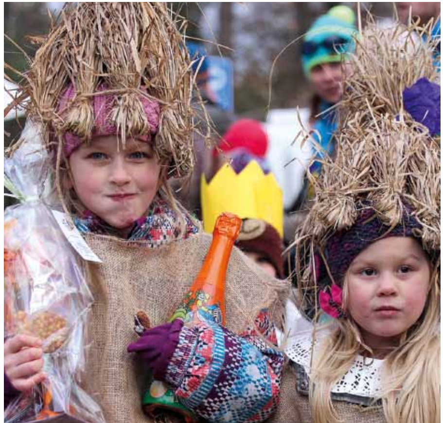
Klánský masopust je už krásnou a veselou tradicí

Letošní masopust jsme jako pořadatelé vyhlíželi s mírnými obavami. Vzhledem ke stavbě na školním dvoře bylo třeba přizpůsobit si plochu parkoviště u školy. Ani termín masopustní neděle letos nevycházel ideálně – prodloužený víkend lákal k výjezdům na hory. Naštěstí nás podrželo počasí, takže Klánský i přespolní dorazili opět v hojném počtu. Zkušenosti už věděli, že vařit nedělní oběd je zbytečné, neboť už před začátkem programu se kouřilo z ovaru či jitrnic ve stánku řezníka Novotného. Dobrovolnice z Pohádkových Klánovic o. p. s. opět napekly sladké dobroty, nasmažily vdolečky, uvařily bramboračku a namazaly chleby s domácími škvarky. Jakmile předal starosta vládu nad obcí maškaram, vyrazil průvod v čele s koňským povozem s dětmi z MŠ na okružní trasu po Klánských. Každá z navštívených hospodyň nás přivítala domácími dobrotami a kořalíčkou a zatančila si s medvědem. Neopomněli jsme ani tradiční návštěvu dětského domova s famózními koláčky.