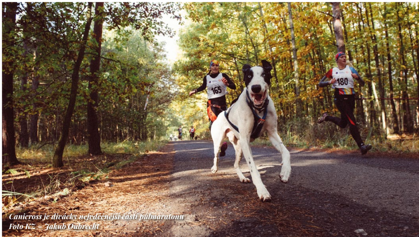
Canicross je divácky nejdělejší částí půlmaratonu