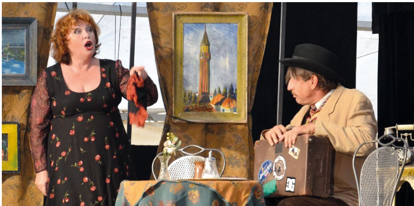
Představení Turecká kavárna má vynikající obsazení