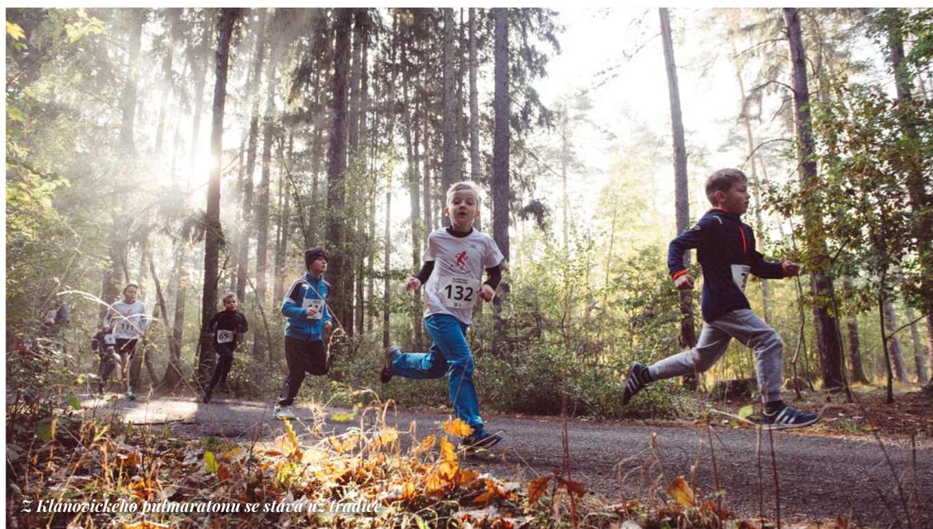
z Klánovického půlmaratonu se stává už tradice