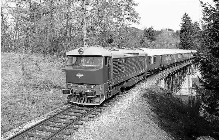
975: Rychlík nad Velkým Meziříčím. Krásný klenutý viadukt se nachází před a současně pod velkým dálničním mostem v km 144 dálnice D1. Zvláštní stavebně technické dědictví se snoubí s vkusně řešenou soupravou retrovlaku a okolní krajinou.

Zvláštní rychlík složený ze tří vkusně opravených vozů tzv. řady „Y“ z bývalé vagonky Bautzen v NDR a v čele citlivě zrekonstruovaná zamračka T 478.1, to byla souprava zvláštního vlaku, která na palubě uvítala 54 cestovatelů z celé Evropy a mezi nimi nechyběli ani naši Kolodějáci. Všechny