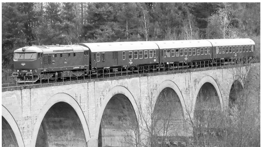
31 Laziště: Souprava retrorychlíků v údolí Sázavy nedaleko Stvořidel, u mostu přes Sázavu v Lazišti, skýtala nádherný pohled na idylu připomínající dobu před 40 lety.

Celou jízdu byl řazen barový vůz KŽC, v němž se kromě jídla točil hořký nymburský ležák 12% a polotmavý speciál Bogdan o stupňovitosti 13%. Vše z provenience luxusního nymburského pivovaru Postřiziny. Cesta byla zdařilá; všem se líbila a většina lidí je již přihlášená na další pokračování: projekty např. Dovolena s retrorychlíkem na Slovensku, Polsku,