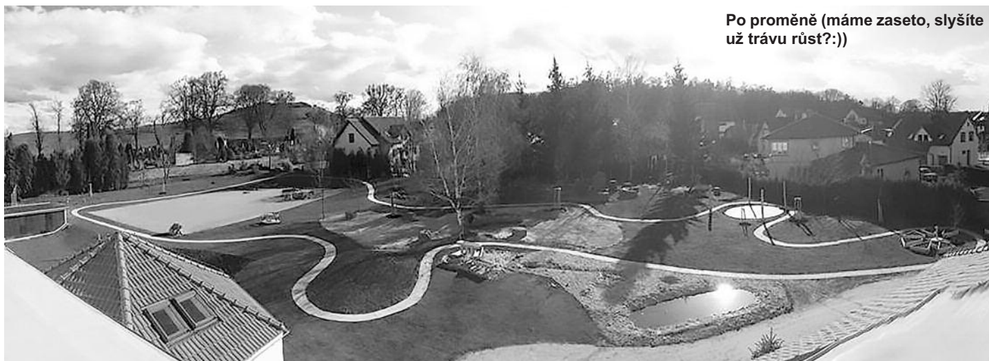
Po proměně (máme zaseto, slyšíte už trávu růst?:))