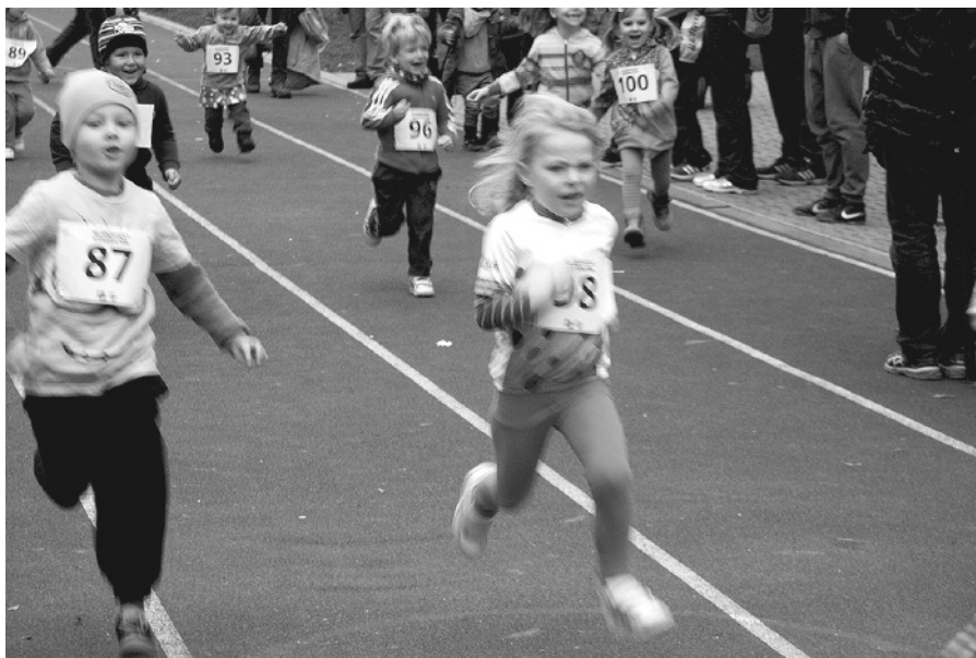
Závody dětí se bojovností a nasazením vyrovnaly soupeření dospělých.