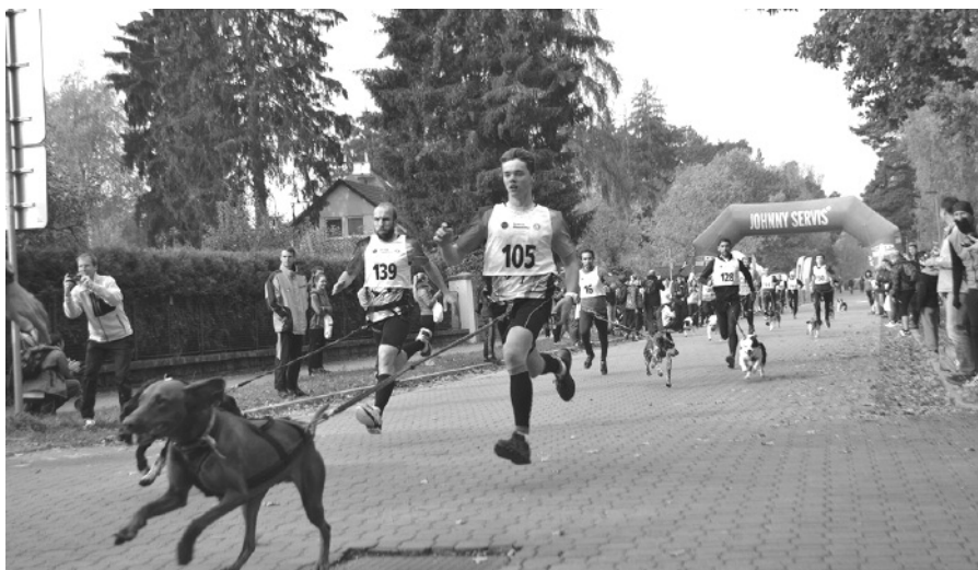
Ani závody se psy nebyly žádnou procházkou, ale tvrdým zápolením.