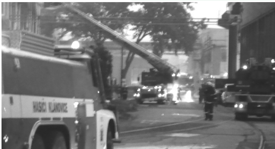
Naši hasiči při likvidaci požáru ČKD, který byl jedním z největších v Praze za mnoho posledních let.