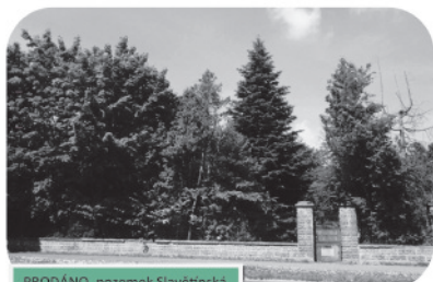
PRODÁNO, pozemek Slavětínská 2 080 m 2 , Klánovice

Ing. Kateřina Černá, 724 646 572, www.ipr-real.cz