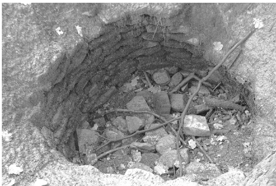
Mezi na první pohled nejviditelnější pozůstatky vesnice Hol patří zbytky gotických studní.