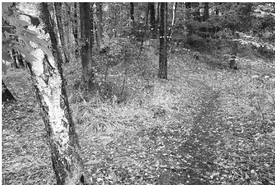
Zbytky vesnice Hol se nacházejí na východ od Štamberku. Vidět zde kvetoucí středověkou vesnici vyžaduje značnou představivost.

A jedná se tedy o Lhotu nad Úvalem a Slavětice?