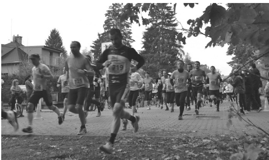
Tolik běžců Klánovický les ještě asi nezažil.