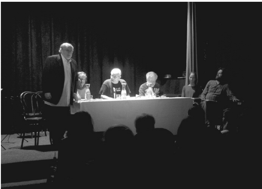
Domácí představení ve hvězdném obsazení.