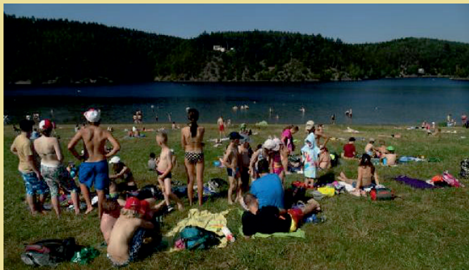
Dočkali jsme se i koupání - Přehrada Hracholusky