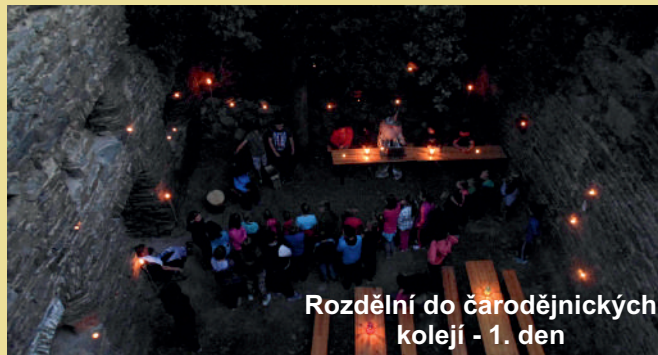
Rozdělní do čarodějnických kolejí - 1. den