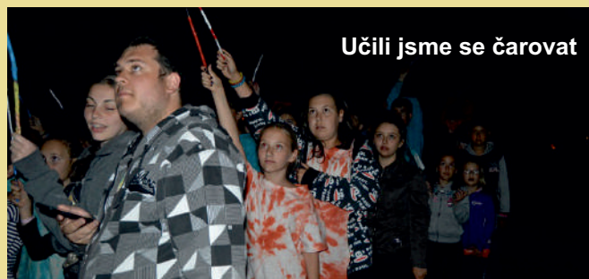
Učili jsme se čarovat