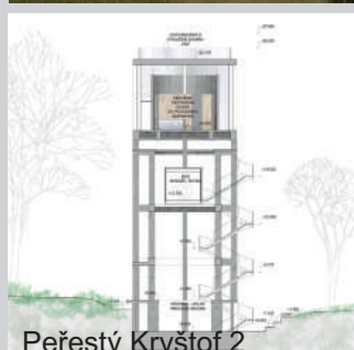
Peřestý Kryštof 2