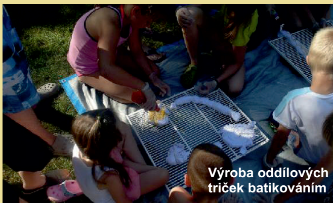
Výroba oddílových triček batikováním