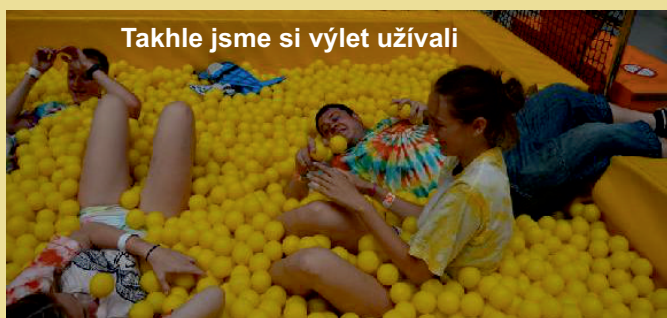
Takhle jsme si výlet užívali