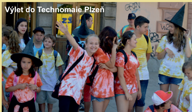
Výlet do Technomaie Plzeň