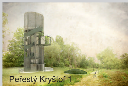
Peřestý Kryštof 1